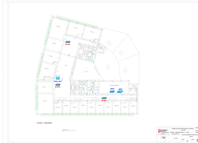
*Figura 5. Planta segunda