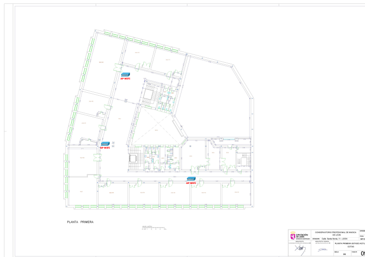
*Figura 4 Planta primera