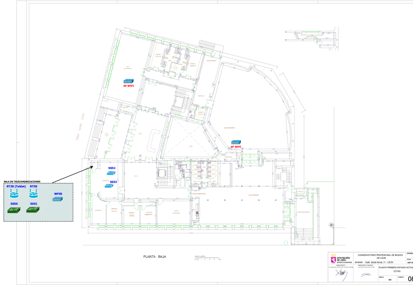
*Figura 3 Planta baja