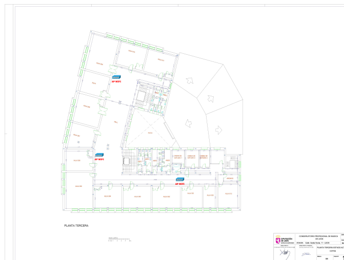
*Figura 6. Planta tercera

La seguridad de estos recursos corre a cargo de los servicios del SATIC servicio dependiente de la Unidad de Informática de la Dirección Provincial de Educación. Cualquier incidencia que se detecte por parte de los usuarios, se comunica a la secretaría y al responsable de recursos informáticos y audiovisuales quienes solicitan el asesoramiento para su resolución a los servicios informáticos de la Dirección Provincial de Educación de León. Dado que no se trata de una red de fibra, se ha establecido un uso cerrado de estas redes para el uso de actividades